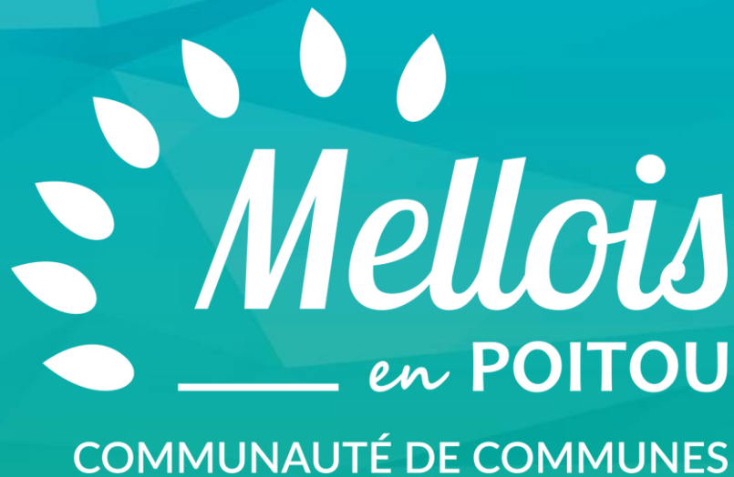
Schéma de cohérence territoriale du Mellois en Poitou

Livre 2 : Projet d'Aménagement et de Développement Durables